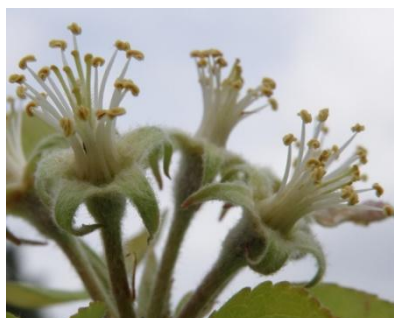
Πτώση πετάλων - Καρπόδεση